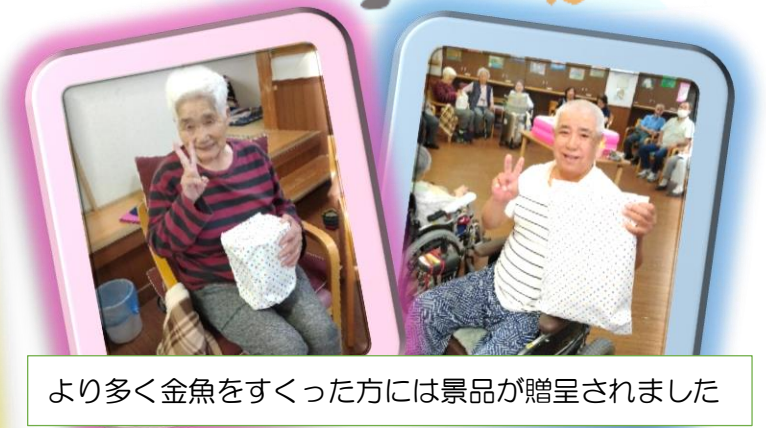
より多く金魚をすくった方には景品が贈呈されました

デイサービス木かげは在宅総合センターふる里内にあります。ご利用者の生きてこられた人生の物語を大切にした介護(ナラティブアプローチ)に努めています。