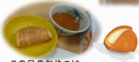
この日のおやつはワッフルです。

素晴らしい！👏 綺麗に足を上げて頂き写真を撮らせて頂きました。ありがとうございます！！！！