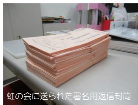
虹の会に送られた署名用返信封筒